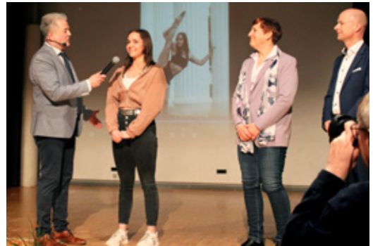
Zahlreiche Sportler und Sportlerinnen standen im Rampenlicht des Forums Ennigloh.