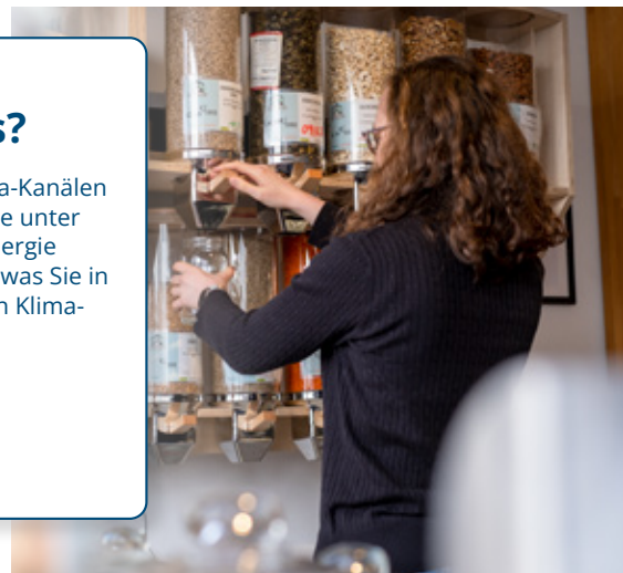
Nachhaltig auch privat: Lebensmittel kauft sie oft im »Tante Else« Unverpacktladen Bünde.

einzelnen auf Dauer auch wirtschaftliche Vorteile. Vor allem aber trägt man selbst aktiv zum Klimaschutz bei, verringert seinen eigenen CO 2 -Fußabdruck und schont dadurch die Umwelt vor seiner Haustür.